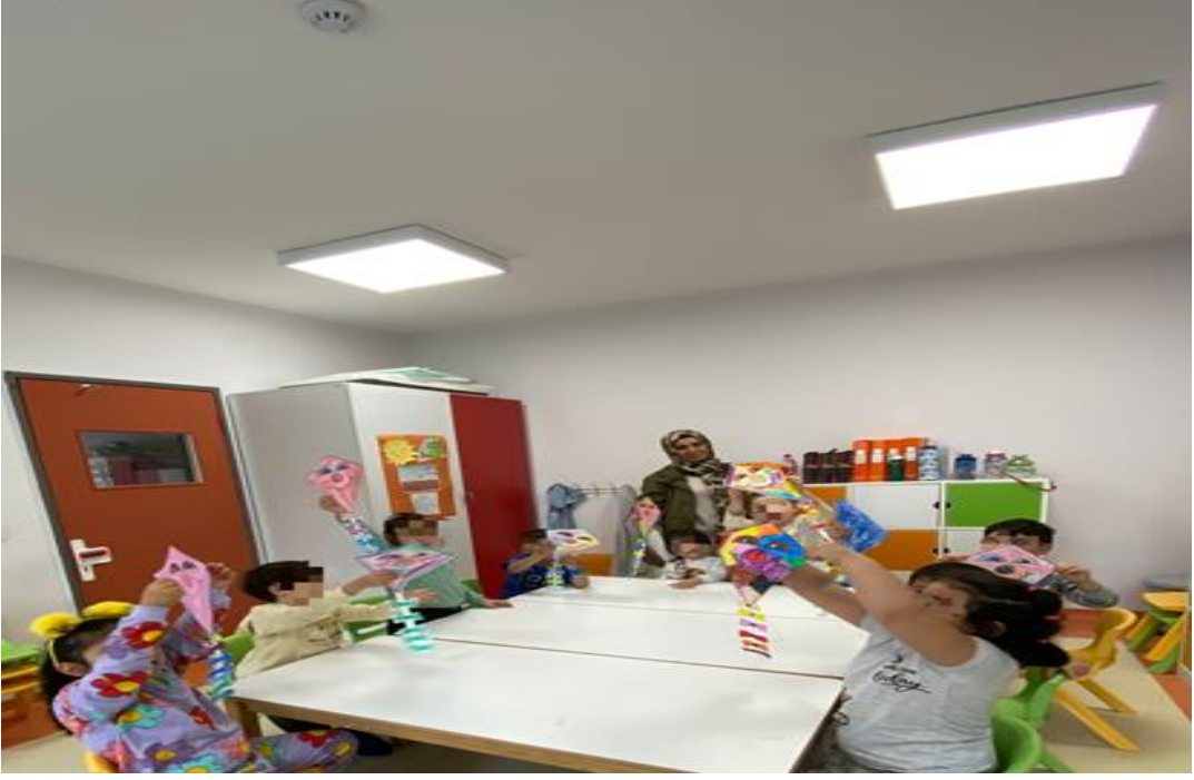
*23 Nisan Ulusal egemenlik ve Çocuk Bayramı ile ilgili etkinliklerden görseller: