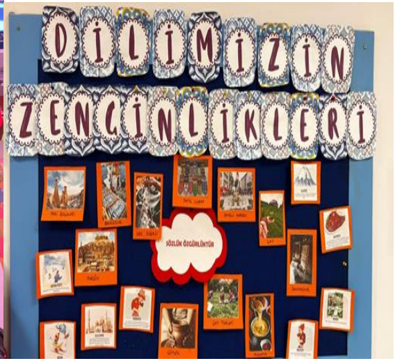
Şubat ayı panosu